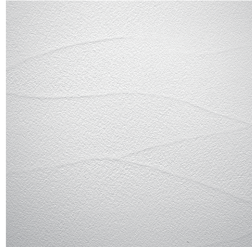
ラフ ゆるやかな波模様の仕上げ。