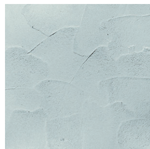
マイクロコテムラ コテムラよりも小さいコテを使って作るコテムラ仕上げ。