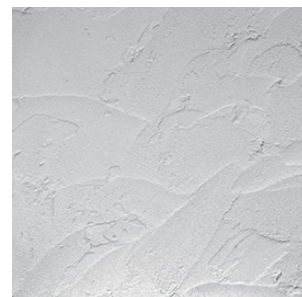
クラウド 不規則に勢よく跳ね上げるコテの動きがワイルドな仕上げ。