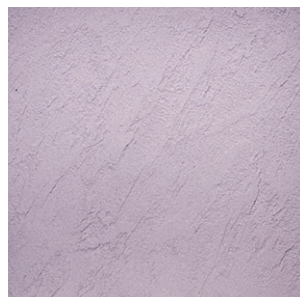
シュメル ナチュラルな風合いのある、ランダムに塗り付けた仕上げ。