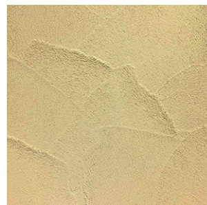
コテムラ コテ波を活かした南欧風の仕上げ。