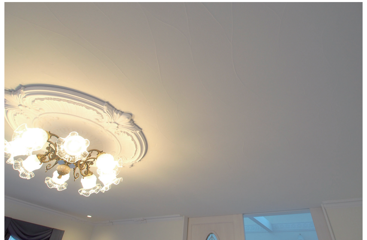
施工:株式会社石井工務所 内装(壁・天井):ユニプラルCL #001 ラフ