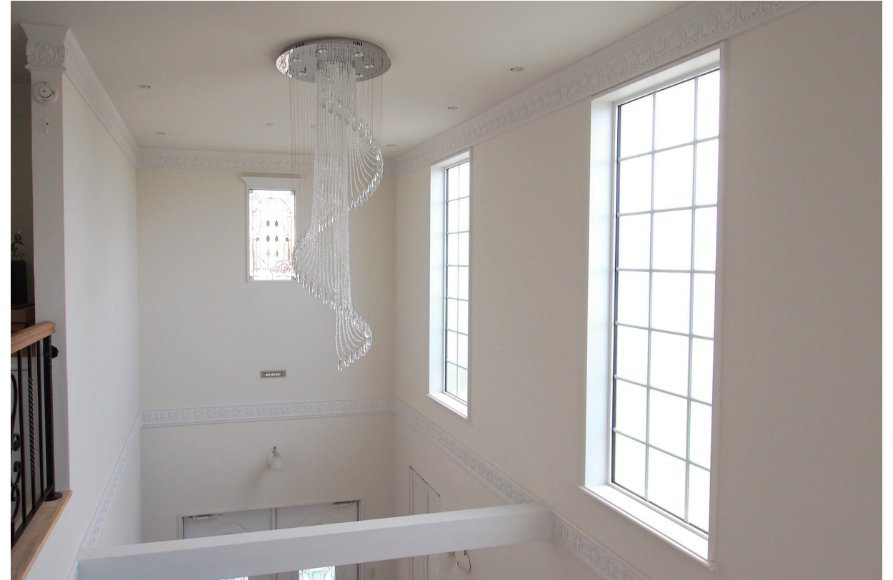
施工:株式会社石井工務所 内装(壁・天井):ユニプラルCL #001 ラフ