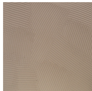
櫛引コテムラ 櫛引のコテを使って作るコテムラ仕上げ。