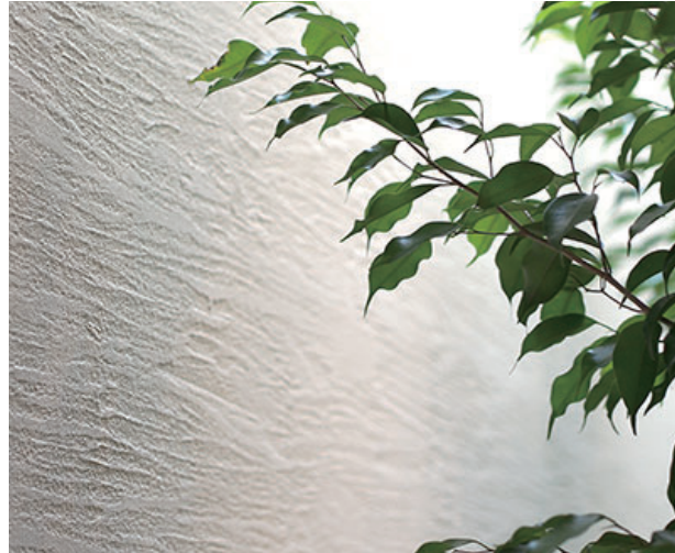
ユニプラルCL#000プレスコ