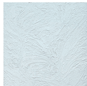
うず 木ゴテを回しながら模様を付け、金ゴテで押さえた仕上げ。