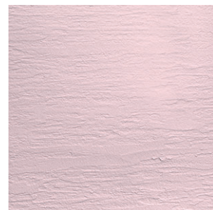
プレスコ 木ゴテを横引きにして模様をつけ、金ゴテで押さえた仕上げ。