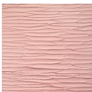
ポタニー(小面積) 細いコテで横引き模様を描いていく凹凸感のある仕上げ。