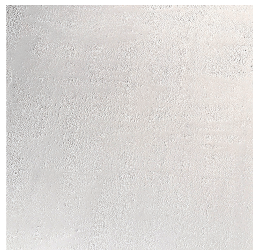
アピオ 仕上厚:1mm 塗り壁らしい自然な風合いにコテでおさえた、淡い光沢のフラットな仕上げ。