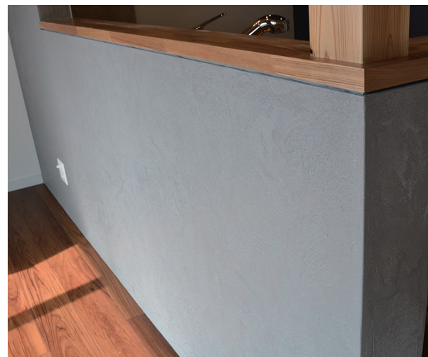
ユニプララルアルテ #特注色 トルネ