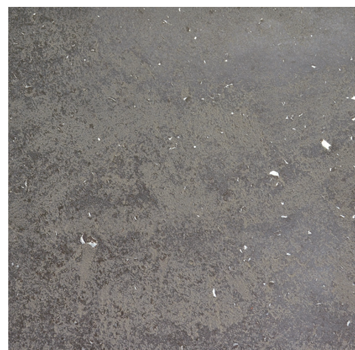
※ワンメイク (マール+マイカ) 仕上厚:1mm