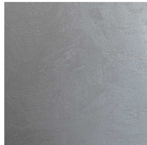
トルネ 仕上厚:1mm コテをまわしながら柄をつけ表面を押さえた、やわらかな陰影の仕上げ。