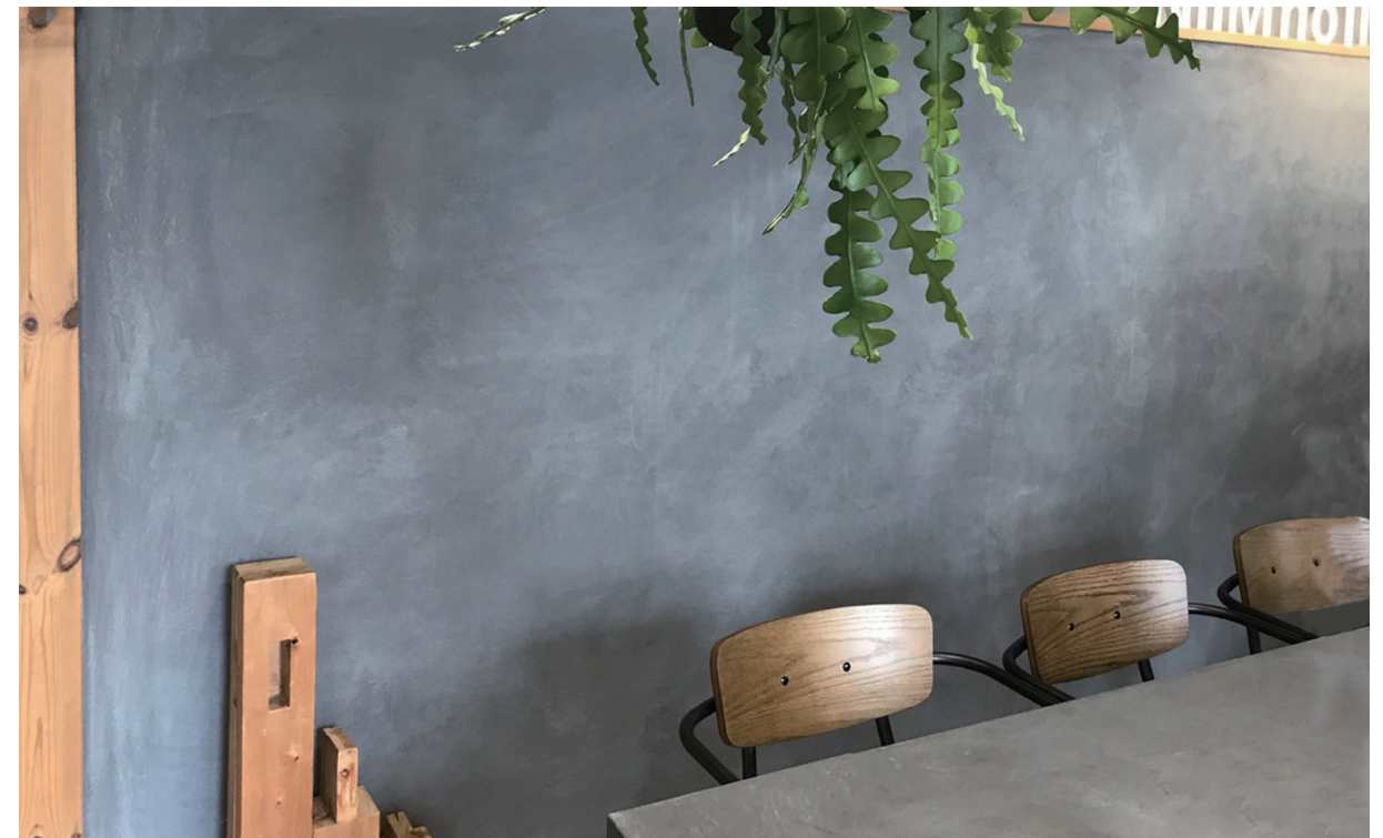
株式会社いもの社 (壁)ユニプララルアルテ #特注色アピオ