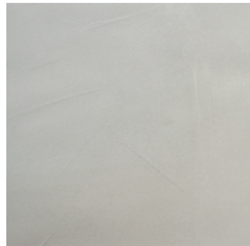
クリスタ 仕上厚:1mm クリスタルの輝きをイメージした、コテ塗りの直線的なラインが輝く仕上げ。