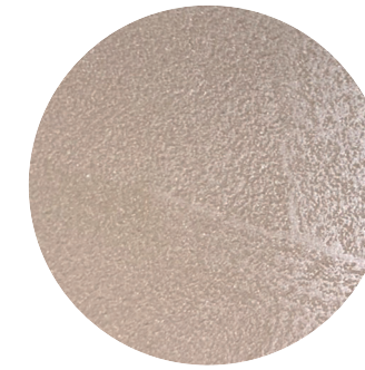
013 ブラウンフォンス