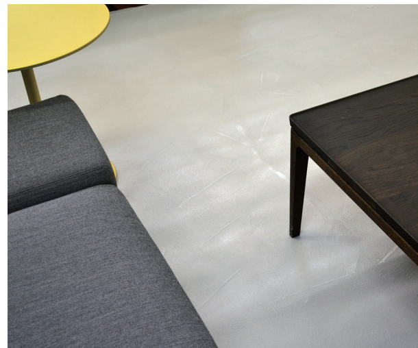
ユニプララルアルテ #276 クリスタ