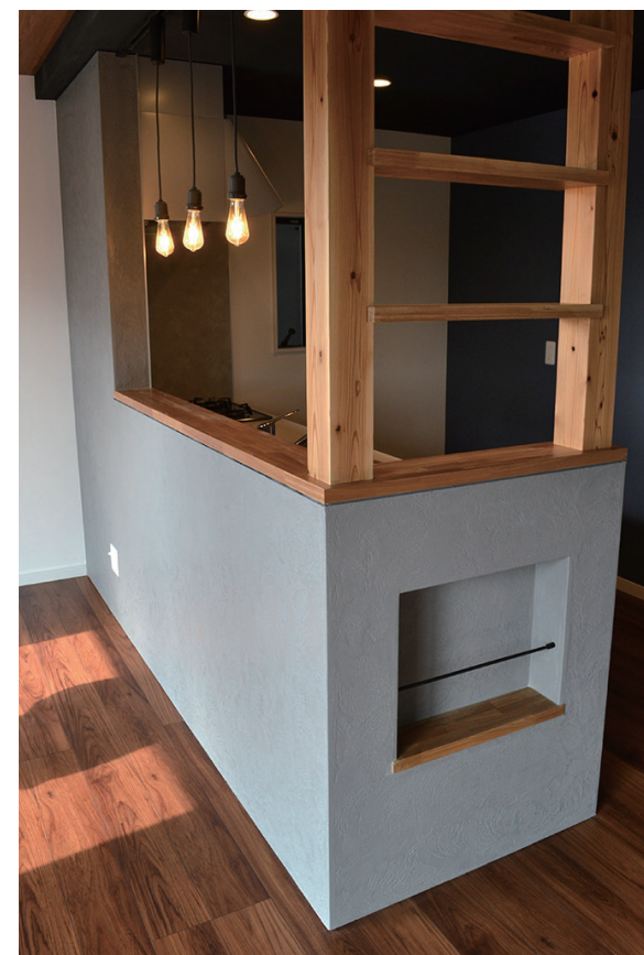
かつ七興産株式会社 ユニプララルアルテ #特注色トルネ