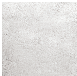
浮雲(うきぐも) 仕上厚:3mm ランダムに柄を付け、表面を平滑に押さえた仕上げ。