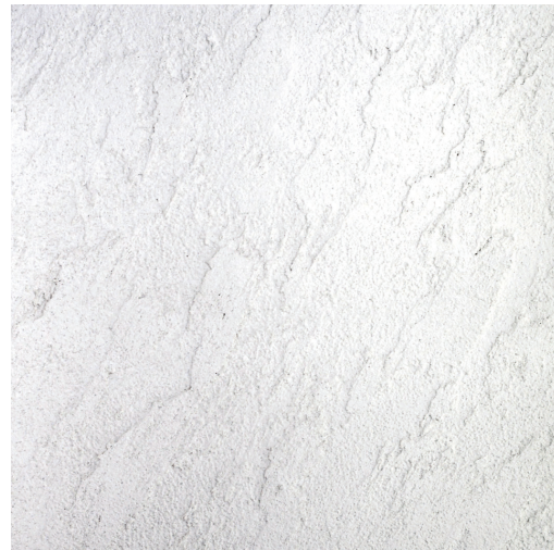
シュメル 仕上厚:3mm ナチュラルな風合いのあるランダムに塗り付けた仕上げ。