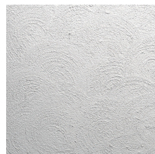
サンタフェ 仕上厚:3mm 扇状に模様付けた仕上げ。