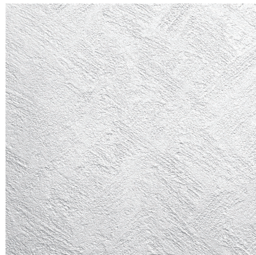
ノワ 仕上厚:3mm 木ゴテでクロス柄に引き、金ゴテで表面を押さえた仕上げ。