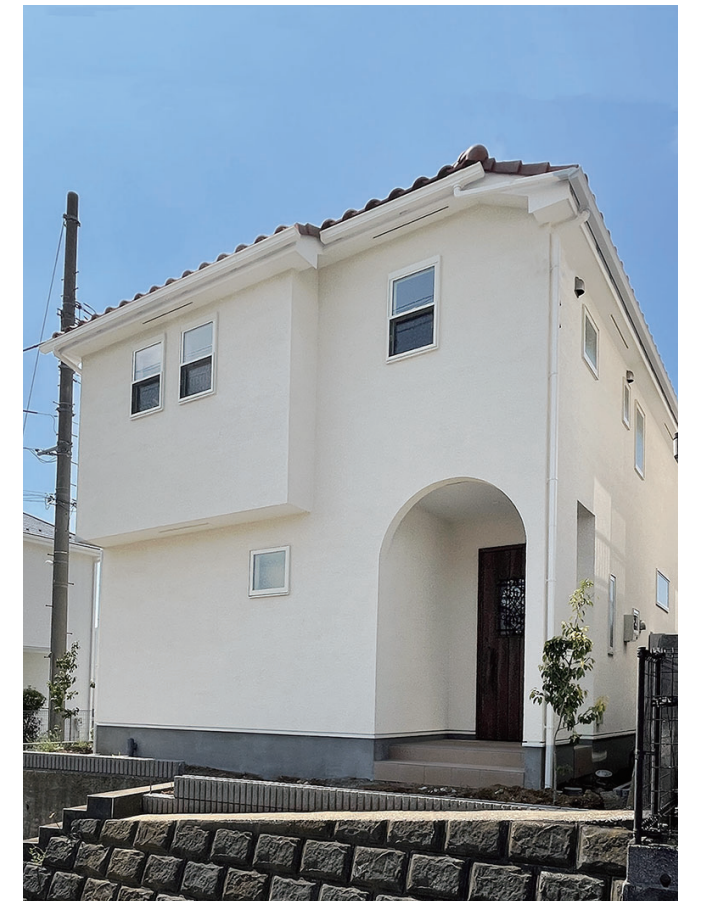
設計施工：株式会社ノルデンハウス ユニプラル Lime #000 イビザ