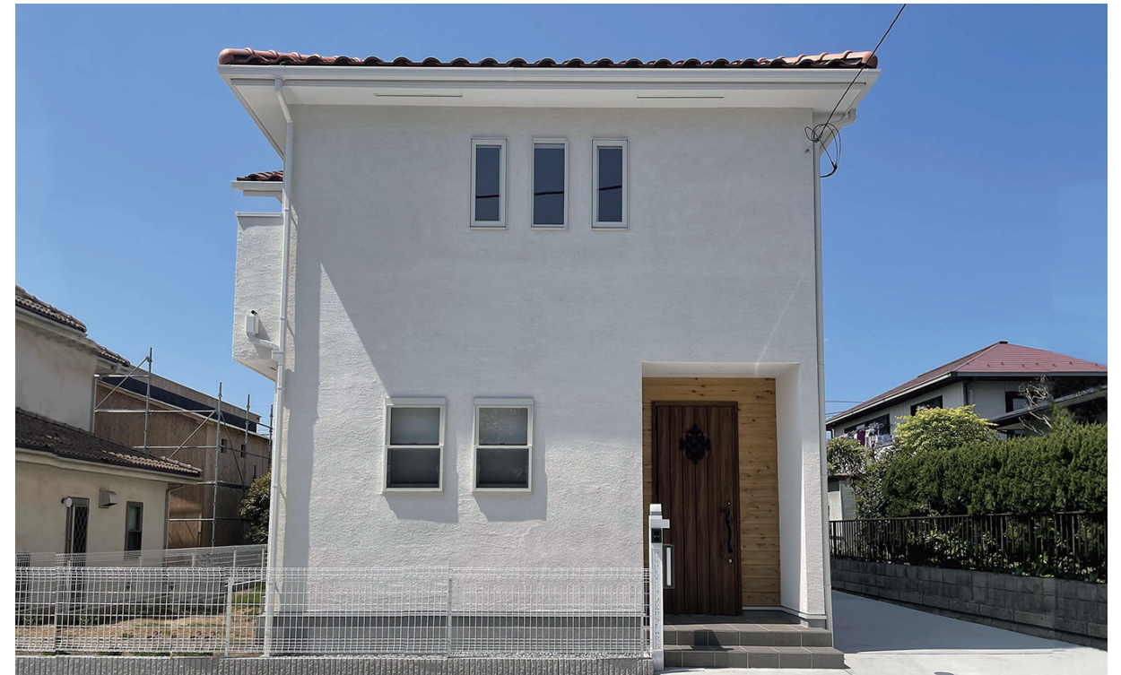
設計施工:株式会社ノルデンハウス ユニプラルLime #000 イビザ