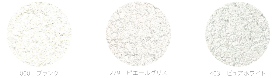
000 ブランク 279 ピエールグリス 403 ピュアホワイト

ユニプラル Lime のカラーは、色数を減らし、漆喰らしい白系の3色展開。人気の高いこちらの3色は、さらりと透き通るようにきれいな漆喰の白。少しだけ、「白」の中にもバリエーションをつけてご用意しました。こだわりの漆喰カラーをお楽しみください。