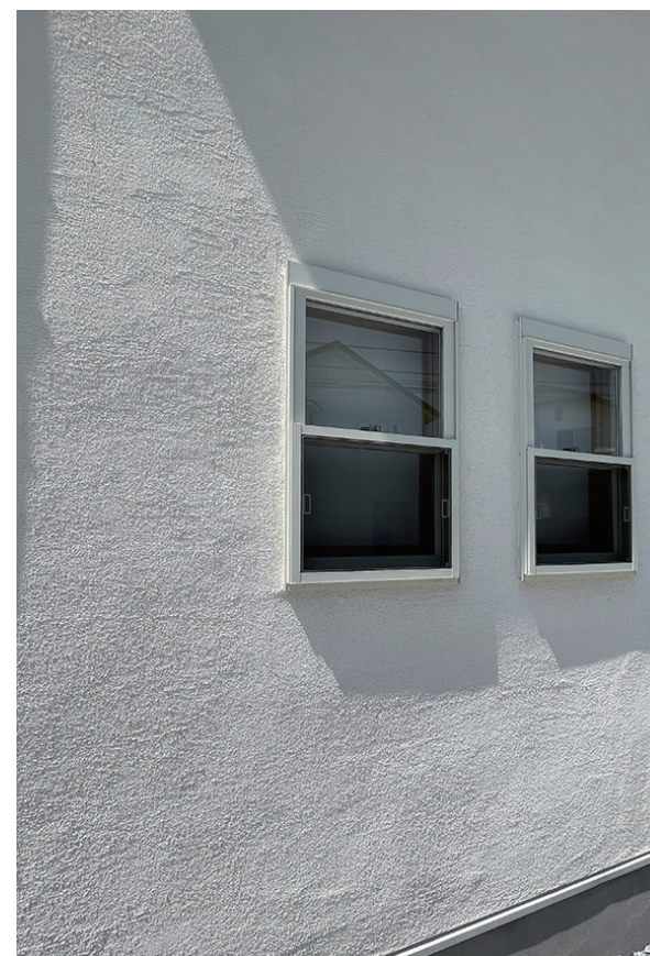
設計施工:株式会社ノルデンハウス ユニプラルLime #000 イビザ