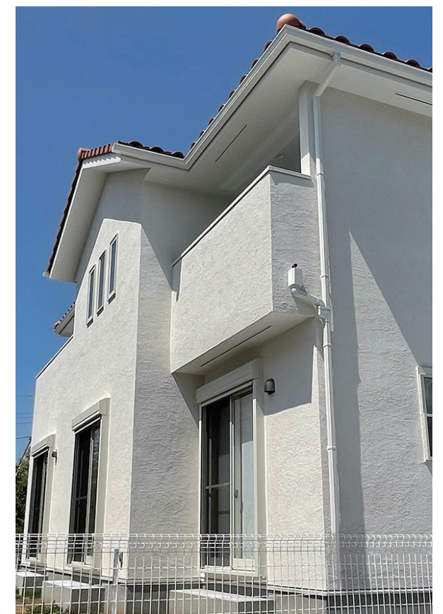
設計施工:株式会社ノルデンハウス ユニプラルLime #000 イビザ