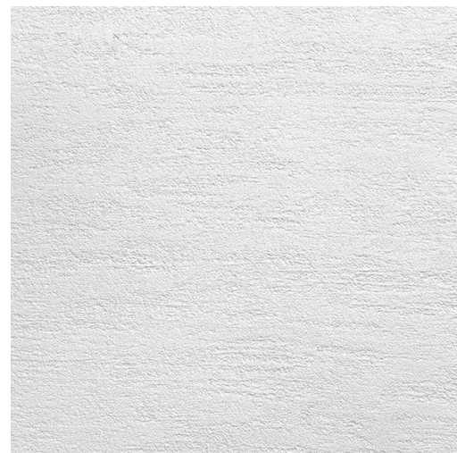
フレスコ 仕上厚:3mm 木ゴテで横引き模様をつけ、金ゴテで表面を押さえた仕上げ。