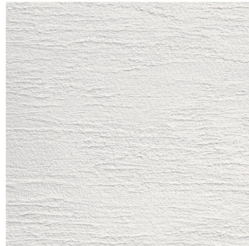
イビザ 仕上厚:3mm 木ゴテで横方向に模様を付けた仕上げ。